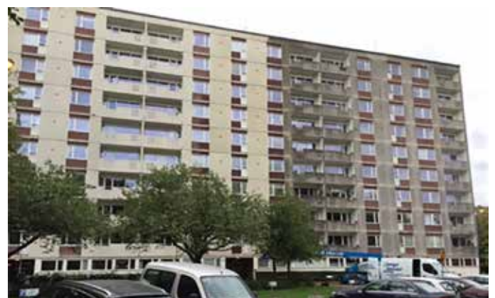
Vänstra delen av byggnaden är tvättad och behandlad med Disboxan 451 Impregneringscreme medan den till höger är obehandlad.

DISBOCRET® 515 BETONGFÄRG Matt högtäckande latexfärg baserad på styrénakrylat, särskilt framtagen för målning på betong. Färgen är karbonatiseringshämmande vilket innebär att den förhindrar kol- (CO 2 ) och svaveldioxid(SO 2 ) att tränga in i betongen och ger därmed ett effektivt skydd mot korrosion på armeringsjärnen i betongen. Kan nyanseras i ett stort antal kulörer. Finns i Nespri-variant för dimfri sprutmålning.